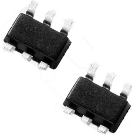
图3. 来自Littelfuse的SDP偏压系列SOT23-6

如需有关本产品的更多信息，包括详细规格、浪涌额定值、包装选择等，请参考Littelfuse网站上提供的数据表。